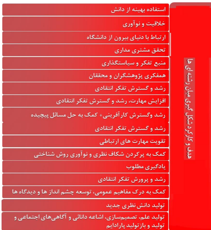
تصویر ۴. هدف و کارکرد مطالعات میان‌رشته‌ای