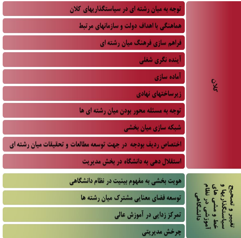
تصویر ۱۴. عوامل توسعه مطالعات میان‌رشته‌ای در سطح کلان