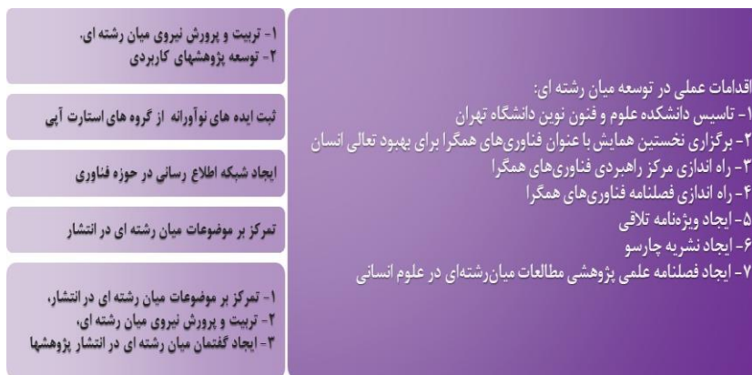
تصویر ۷. اقدامات عملی در ایجاد مطالعات میان‌رشته‌ای تاکنون