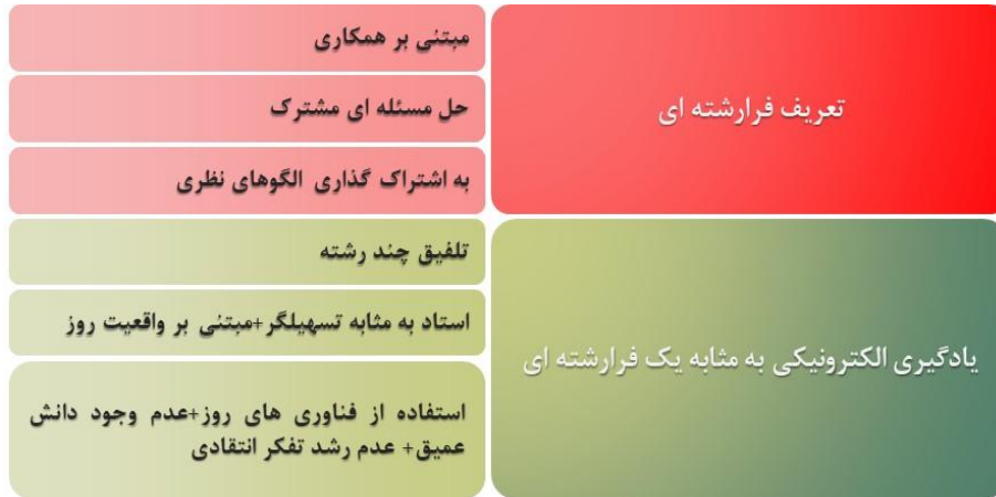
تصویر ۲. ماهیت مطالعات فرارشته‌ای در نظام دانشگاهی