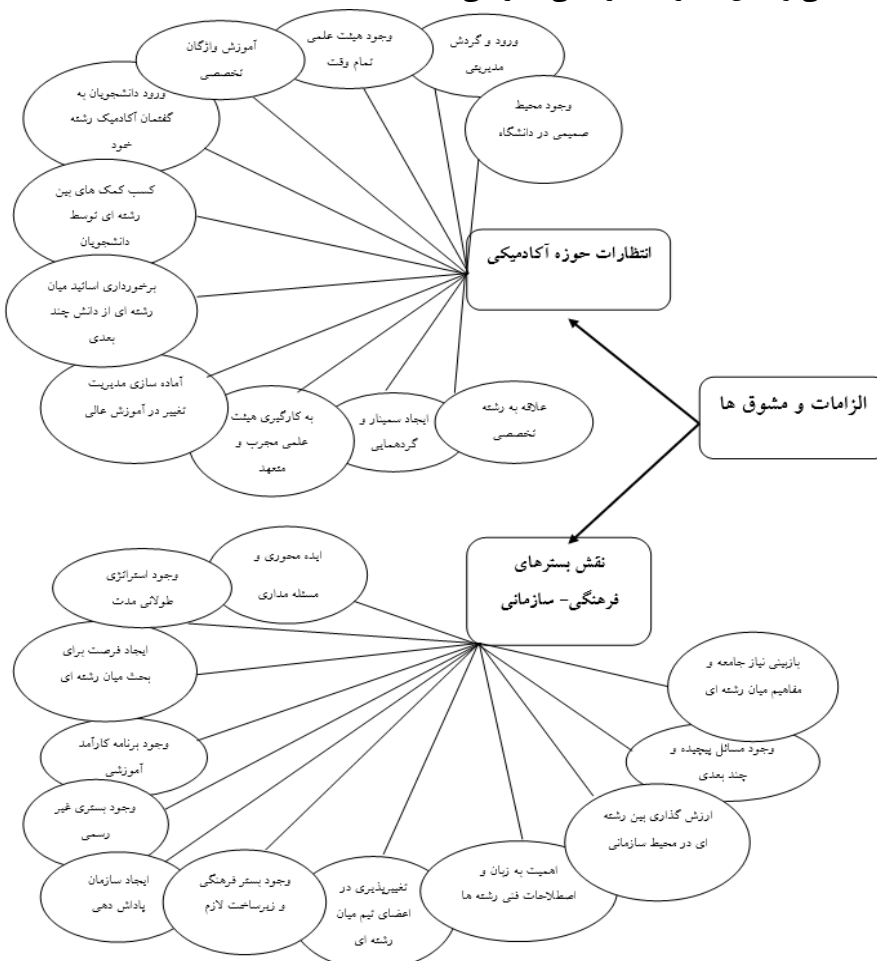
تصویر ۱۱. الزامات و عوامل شکل‌گیری و توسعه مطالعات میان‌رشته‌ای

محیط‌زیستی و زیست‌شناسی مصنوعی) از رشته‌های موجود و به‌دلیل همکاری‌های میان‌رشته‌ای شکل‌گرفته‌اند (لیول و همکاران، ۲۰۱۵). تامسون کلاین (۱۳۸۹: ۱۴۵) نیز دسته‌بندی را از عوامل مشوق و تسهیلگر شکل‌گیری و توسعه مطالعات میان‌رشته‌ای دانسته که به خط‌مشی‌های مدیریت و ساختار سازمانی، رهبری، حمایت و سرپرستی، تأمین بودجه، حمایت زیرساختی، و توجه رسمی به مبحث میان‌رشته‌ای اشاره دارد. همچنین یافته‌های پژوهش اول پردیس البرز درباره حوزه‌های میان‌رشته‌ای نشان داد مشوق‌های موجود در زمینه مطالعات میان‌رشته‌ای براساس تحلیل مصاحبه‌ها به دو مؤلفه اصلی اشاره دارد: انتظارات حوزه آکادمیکی و نقش بسترهای فرهنگی-سازمانی.