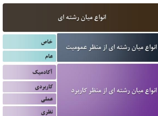
تصویر ۳. انواع مطالعه میان‌رشته‌ای در نظام دانشگاهی