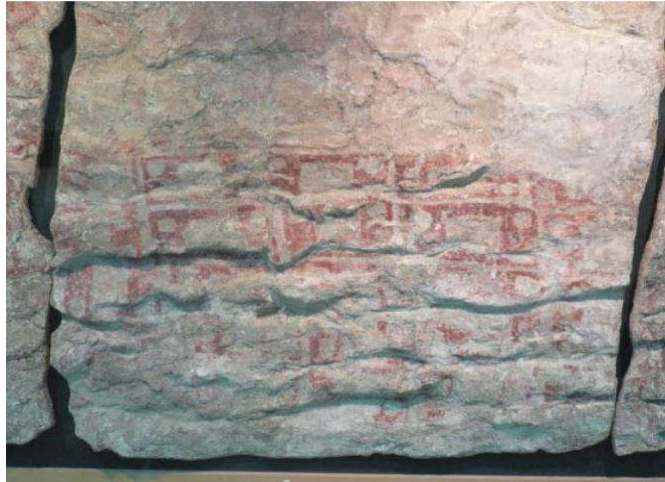
چتل هویوک، ترکیه ۱ (اولین نقشه شهری کشف شده)