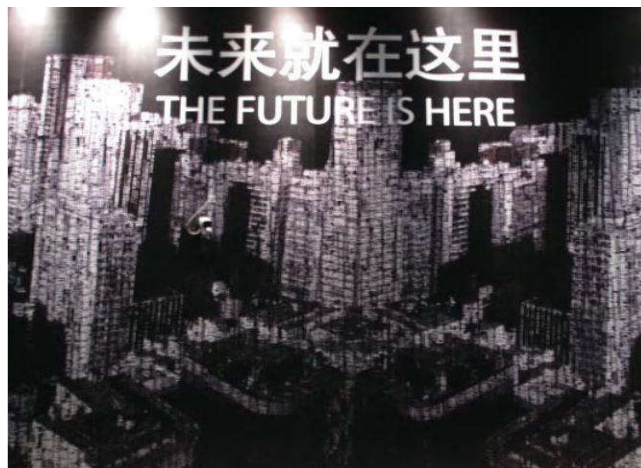
اکسپوی شانگهای سال ۲۰۱۰ میلادی

شهرها استادانه‌ترین آفرینش انسان از آغاز جامعه بشری بوده‌اند. در طول ده هزار سال، شهرها مکان‌هایی برای نمایش قدرت، فرهنگ، فناوری و صحنه نبردها و کشمکش‌ها بوده‌اند. در طول سده بیست و یکم بیش از نیمی از انسان‌ها در شهرها زندگی می‌کنند. شهر مهم‌ترین زیستگاه انسان‌ها بوده است و خواهد بود. مدیریت شهر، مراقبت و هدایت توسعه آن، با توجه به گذشته و معنای فرهنگی آن، مهم‌ترین چالش سده شهری حاضر خواهد بود.