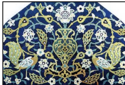
تصویر ۱-۰: نقش طاووس، سردر اصلی پیش از تخریب (رضازاده اردبیلی، ۱۳۹۰: ۳۶).