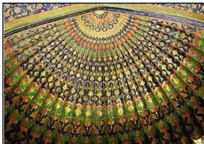
تصویر ۲-۰: نقش پر طاووس، سردر ورودی مقبره

تصویر به‌کاررفته، در سال ۱۳۹۶ توسط مؤلف در بازدید از مجموعه مزار شیخ صفی‌الدین گرفته شده است. در کنار ورودی دارالحفاظ کتیبه مربوط به شاه‌طهماسب است که تنها کتیبه مشهور صفوی است. رواق دارالحفاظ یا قندیل‌خانه پس از ساخت گنبد الله الله و به دستور شیخ صدرالدین حدود سال‌های ۷۴۵ تا ۷۶۵ هـ-ق در تکمیل زاویه حاجی سام (شاه‌نشین) می‌دانند. این بنا که طول آن ۱۱/۵ متر و عرض آن ۶ متر است با ایوان‌های مضاعف دو طبقه، با دو پله مرمرین و نرده فلزی نقره‌کوب از شاه‌نشین مجلل جدا می‌شود. در گذشته سقف نیم‌گنبد (طاق گهواره‌ای) بوده است و تصویر قالی معروف اردبیل که فضای دارالحفاظ را مفروش کرده، روی آن نقاشی شده بود. قالی معروف اردبیل که به دستور شاه‌طهماسب به تاریخ ۹۴۶ بافته شده بود و به طول ۱۱/۳۸ متر و عرض ۵/۳۴ متر دارالحفاظ را می‌پوشانید، در همان سال‌های خرابی سقف، به دست تاجری تبریزی روانه خارج از کشور می‌شود و فعلاً در موزه آلبرت هال لندن است. این فرش تاریخ و امضا دارد و به‌دست مقصود کاشانی بافته شده است (رضازاده اردبیلی، ۱۳۷۴: ۶۵۴) در قسمت داخلی دالان ورودی این قسمت روی دیوار کاشی‌کاری مزین به نقش دو طاووس متقارن وجود دارد. این مجموعه به صورت یکپارچه و پس از تخریب سردر اصلی مجموعه مزار که در سال ۱۳۲۱ به دستور فرماندار شهر اتفاق افتاد، به قسمت مذکور انتقال یافت و روی دیوار نصب شد. طبق مقاله مؤلف با عنوان «تأثیر تفکر طریقت بر شکل‌گیری مجموعه مزار شیخ صفی‌الدین اردبیلی» که در نشریه هنرهای زیبا در سال ۱۳۹۰ به چاپ رسیده، مراحل هفتگانه سلسله‌مراتب این مجموعه تشریح شده است. مجموعه مزار شیخ صفی‌الدین در قسمت سردر اصلی و مقام اول با طاووس شروع می‌شود و در قسمت ورودی و مقام هفتم به پر طاووس ختم می‌شود.